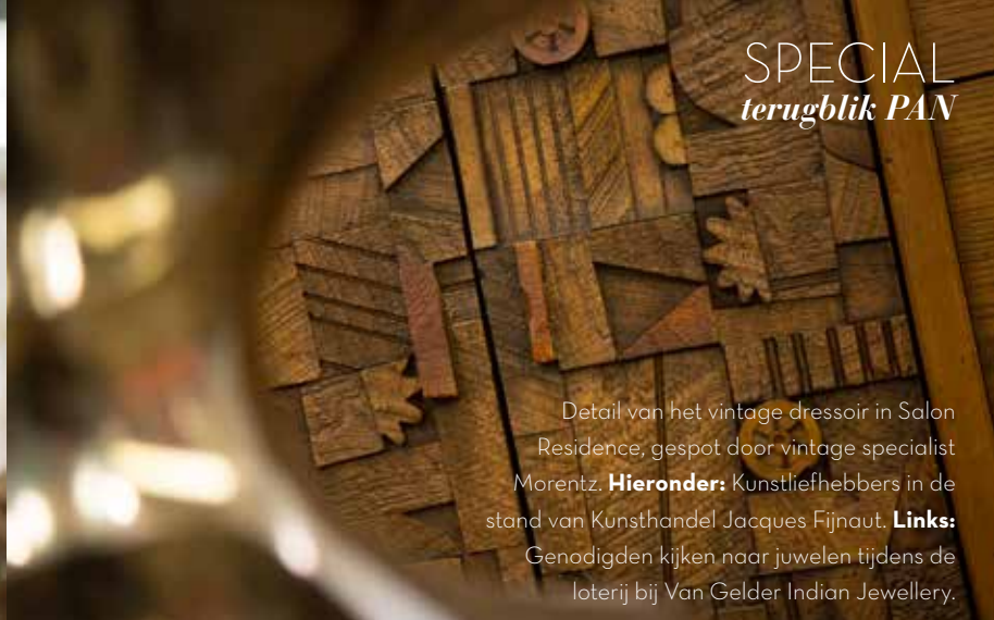
Detail van het vintage dressoir in Salon Residence, gespot door vintage specialist Morentz. Hieronder: Kunstliefhebbers in de stand van Kunsthandel Jacques Fijnaut. Links: Genodigden kijken naar juwelen tijdens de loterij bij Van Gelder Indian Jewellery.